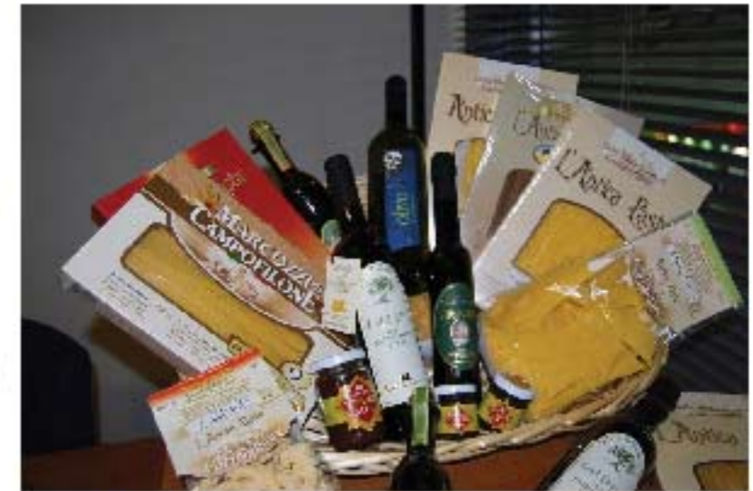
I prodotti della famiglia Marcozzi, pastificio in Campofilone

I primi documenti scritti su tale prodotto risalgono al Concilio di Trento del 1560, in occasione del quale si parlava di una pasta "così sottile da sciogliersi in bocca". Da allora, sempre più frequenti sono le testimonianze scritte di questa tradizione: dalle ricette inserite nei quaderni di cucina di alcune casate nobili del '700 e '800 - come i conti Stelluti-Scala e i conti Vinci - alla personale "classifica" di Giacomo Leopardi che indicava al cuoco di casa cosa gradisse di più mangiare suggerendo tra i piatti preferiti anche i maccheroncini preparati in diversi modi.